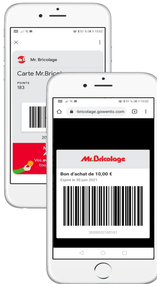
Chèque mobile wallet